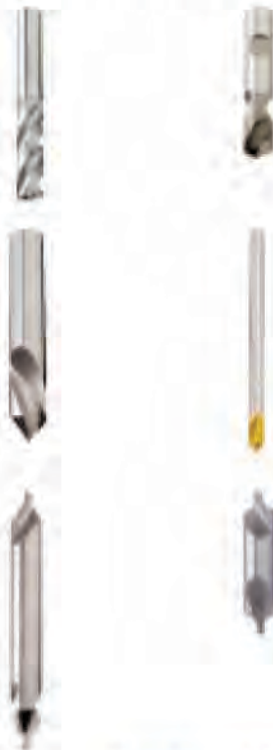
Verwaltung und Lager

Pilotbohrer Zentrierbohrer Hartmetall und HSS-E